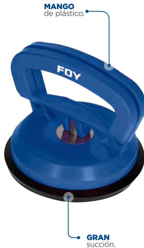
MANGO de plástico.