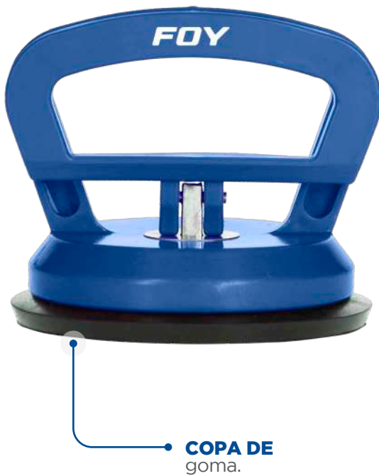
COPA DE goma.