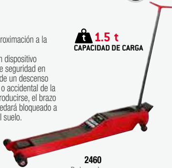
2460 De largo alcance