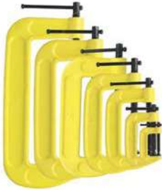
De hierro nodular