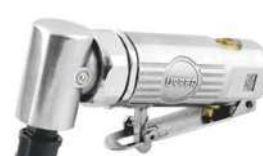
UP875 • Boquilla 1/4". • Cabeza en ángulo de 90° que permite flexibilidad en espacios reducidos.