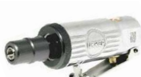
UP876 • Boquilla 1/4".