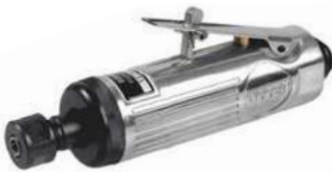
UP860 • Boquilla 1/4".