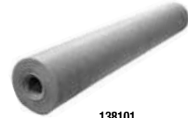
138101 En bobina