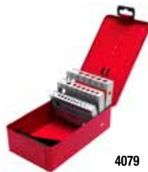
4079 Para 29 brocas 1/16" a 1/2"