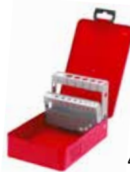
4077 Para 15 brocas 1/16" a 1/2"