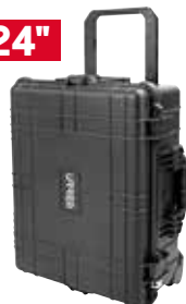
CPI24R Con ruedas