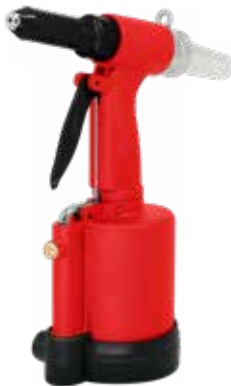
Remaches de aluminio.