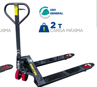
TRHLI2 • Uso ligero.