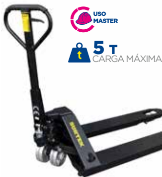
TRH5 • Uso máster.