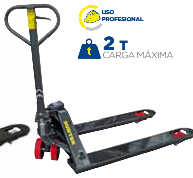
TRHB2 • Con báscula.