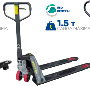
TRHB15 • Extra baja.