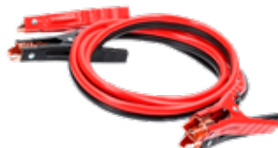
6 AWG CPA6A