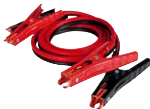
4 AWG 200A