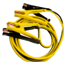
8 AWG 107343