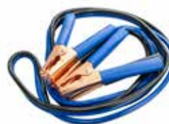
10 AWG 140976