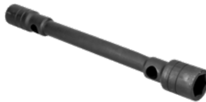
Boca cuadrado Boca hexágono