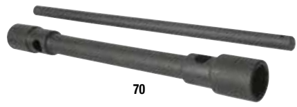
Boca cuadrado Boca hexágono