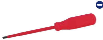
9716 Destornilladores punta plana barra redonda