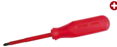
9700 Destornilladores punta Phillips® barra redonda