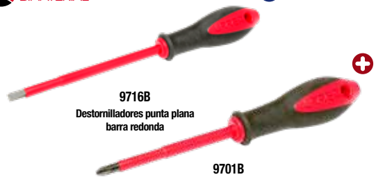
9716B Destornilladores punta plana barra redonda