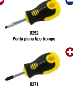
D252 Punta plana tipo trompo