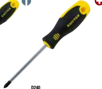
D240 Punta Phillips® barra redonda