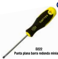
D222 Punta plana barra redonda miniatura