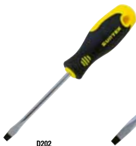
D202 Punta plana barra redonda