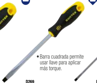
D269 Punta plana barra cuadrada

• Barra cuadrada permite usar llave para aplicar más torque.