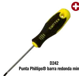
D242 Punta Phillips® barra redonda miniatura