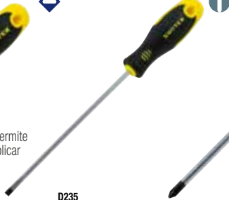
D235 Punta cabinet barra redonda

• Barra cuadrada permite usar llave para aplicar más torque.