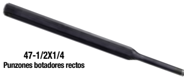
47-1/2X1/4 Punzones botadores rectos