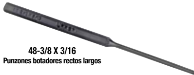
48-3/8 X 3/16 Punzones botadores rectos largos