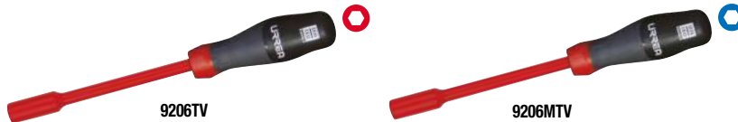
9206TV Destornilladores tri-material de caja en pulgadas