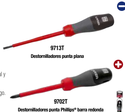
9713T Destornilladores punta plana