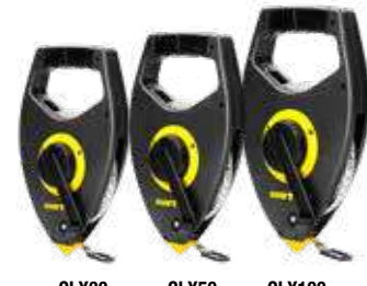
CLX30 CLX50 CLX100

• Mango ergonómico. • Caja tipo cruceta de plástico. • Mango TPR (Termoplastic rubber). • Sistema de embobinado cinco veces más rápido que las cintas tradicionales.