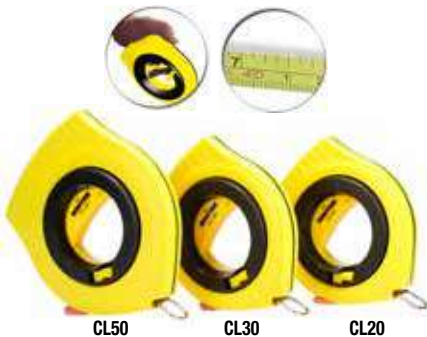
CL50 CL30 CL20

• Impresión a dos tintas para fácil lectura. • Facilidad de uso por su diseño de apertura en el centro. • Norma: NOM-046-SCFI-1999.