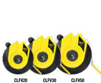
CLFV20 CLFV30 CLFV50

• Sistema de rebobinado rápido reforzado de larga duración.