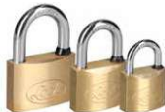
L20S60BB L20S50BB L20S40BB

ANTI-IMPACTO ANTI-PALANCA ANTI-GANZÚA DOBLE CERROJO