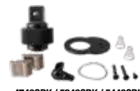
4749GRK / 5249GRK / 5449GRK