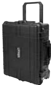
CPI24R Con ruedas