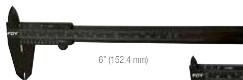
6" (152.4 mm)