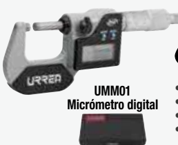
UMM01 Micrómetro digital