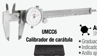
UMCC6 Calibrador de carátula