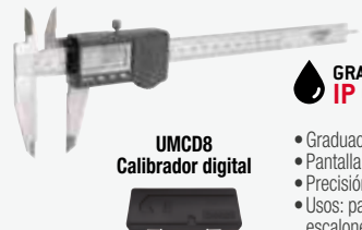
UMCD8 Calibrador digital