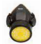
Para un cartucho.