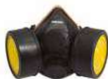
Para doble cartucho.