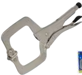
115089 Tipo "C"