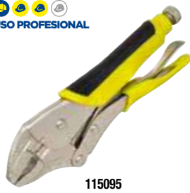
115095 Mango bimaterial