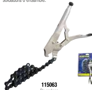
115063 De cadena