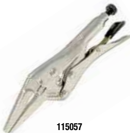
115057 Nariz larga