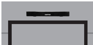
Colgando encima de la TV. Hung above TV